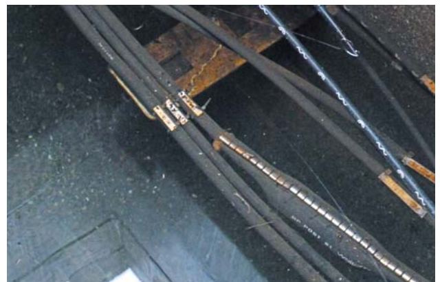
Extreem geval: Deze kabelschacht staat compleet onder water.

De standaard G.652 heeft de ITU uitgewerkt. De IEC/CENELEC nam deze vezeltypen als "OS1" resp. "OS2" op in de normen voor de toepassingsneutrale bekabeling, de ISO/IEC 11801 en de DIN EN 51073 – waarbij de dempingwaarden hier hoger liggen dan in documenten van de IEC en van de CENELEC (60793-2-50), waar in deze norm naar verwezen wordt. De parameters van de IEC 60793-2-50 zijn gelijk aan die van de standaards ITU G.652.D.