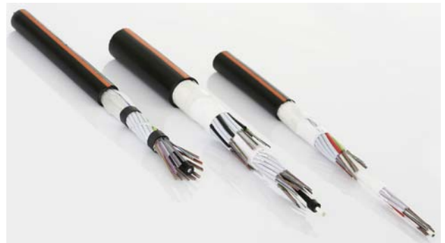
“FO Outdoor” buitenkabels van Datwyler zijn door de combinatie van de HDPE-mantel, bronelementen en met gel gevulde aders “quasi dwarswaterdicht”.

Glasvezel-buitenkabels met een mantel met een extra golf- of aluminium laag zijn door hun hermetische afdichting volledig bestand tegen water van buitenaf. Een mogelijk negatieve invloed van vocht binnen de kabel wordt ook hier uitgesloten door de bronmaterialen en de met gel gevulde aders. De installateur moet bij het leggen van met metaal beklede kabels echter rekening houden met de aarding. Bovendien zijn de kosten bij het afzetten van de kabel iets hoger dan bij kabels zonder metaalhoudende mantels.